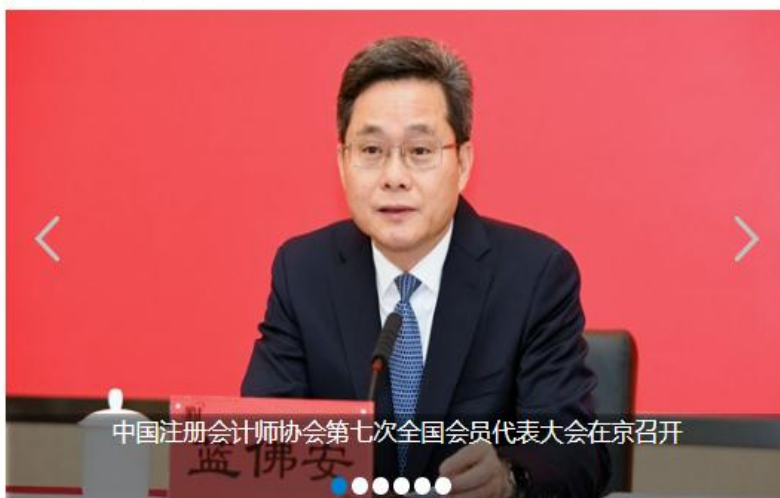
中国注册会计师协会第七次全国会员代表大会在京召开