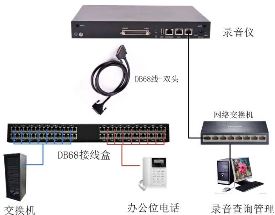
图 1 录音仪组网拓扑图