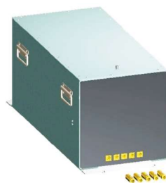
FCC品牌大电流耦合去耦网络

FCC品牌大电流耦合去耦网络符合IEC 61000-4-6传导抗扰度测试要求，电流高达200A。支持2/3/4/5线电源线，应用广泛。