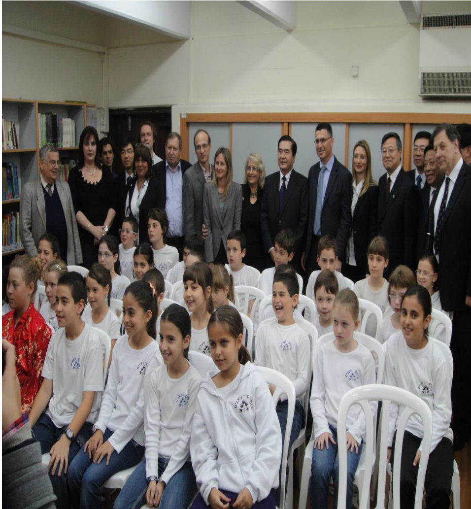
以色列教育部长陪同中国教育代表团参观孔子课堂