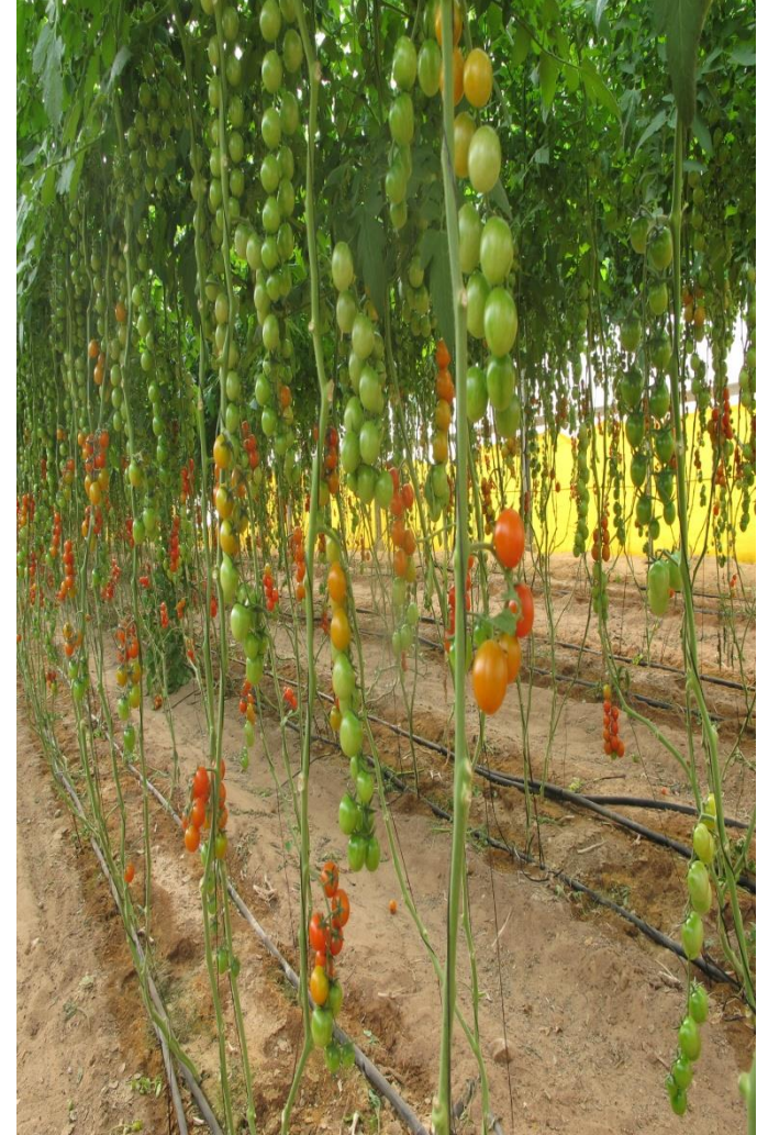
沙漠里种植西红柿