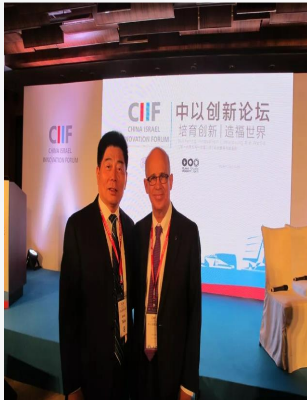
与以色列特拉维夫大学校长在中以高峰论坛上合影

(2) 全国各省、区、市有关部 门进一步认识到研学实践教 育对我国人才培养的重要性、 迫切性；