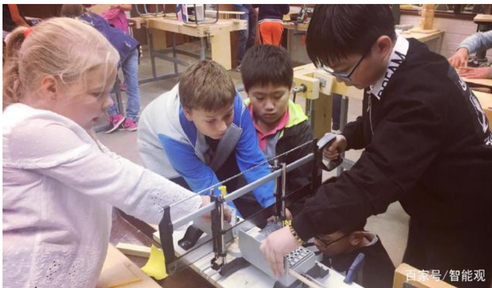
从小培养孩子的动手能力