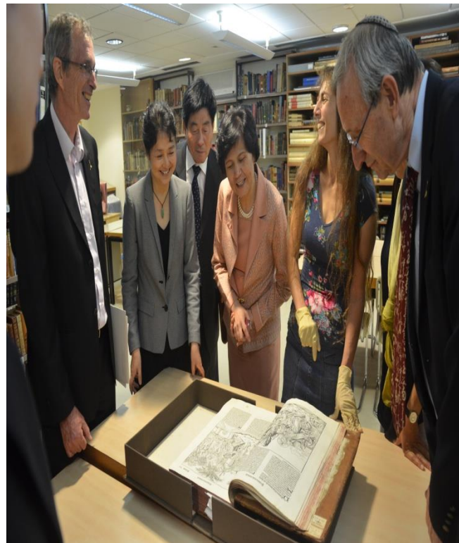
中国驻以色列大使等 参观爱因斯坦图书馆