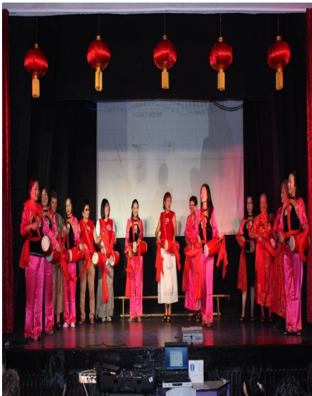
以色列华人华侨庆祝 我国国庆