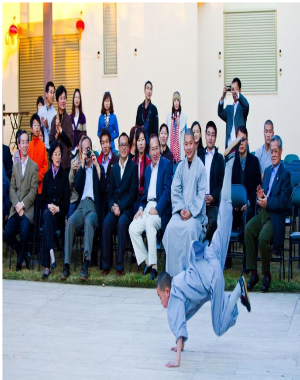
少林寺武术到中国驻以色列大使馆表演