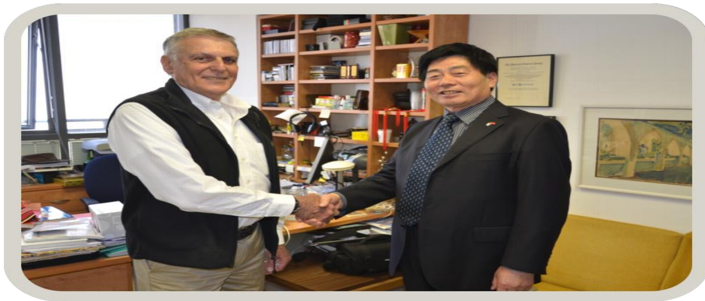
访问以色列理工大学诺贝尔获得者丹尼尔·谢赫特曼教授