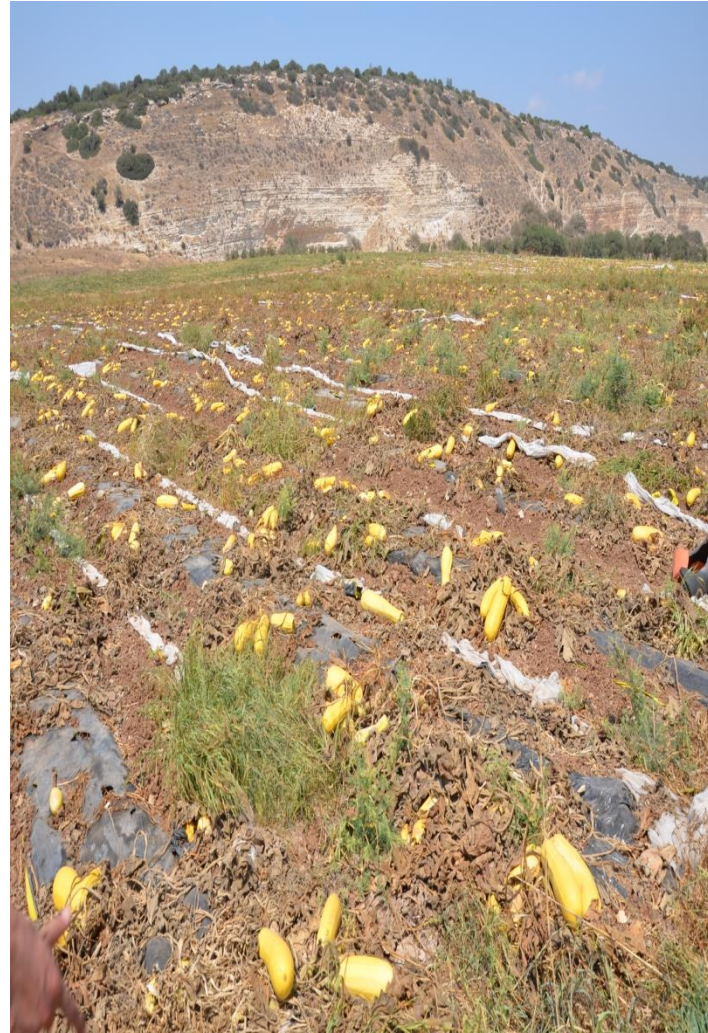
收获后的南瓜地（沙漠高产田）