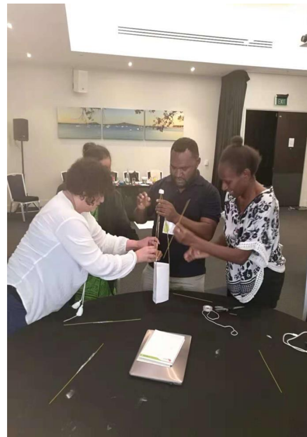
在新西兰参加《教育2030框架基层领导培训》培训学习时的场景