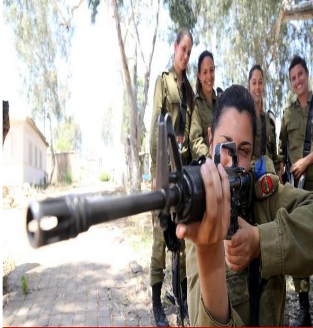
以色列女兵的部队生活