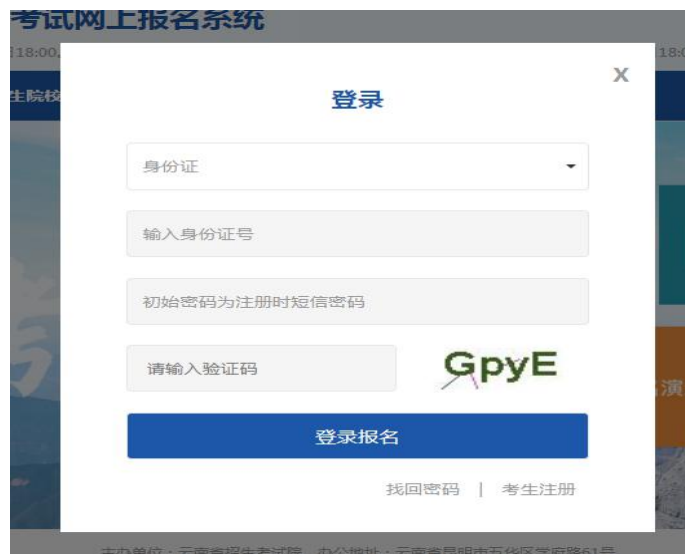
图 2 登录页面