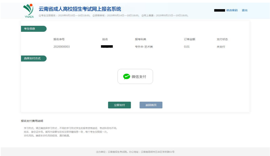
图 10 支付状态

户籍审核和确认点审核通过后，点击【去支付】进入到订单支付页面，如图 10，点击【立即支付】，弹出微信二维码支付页面，使用微信 APP 进行扫码支付，完成支付操作。