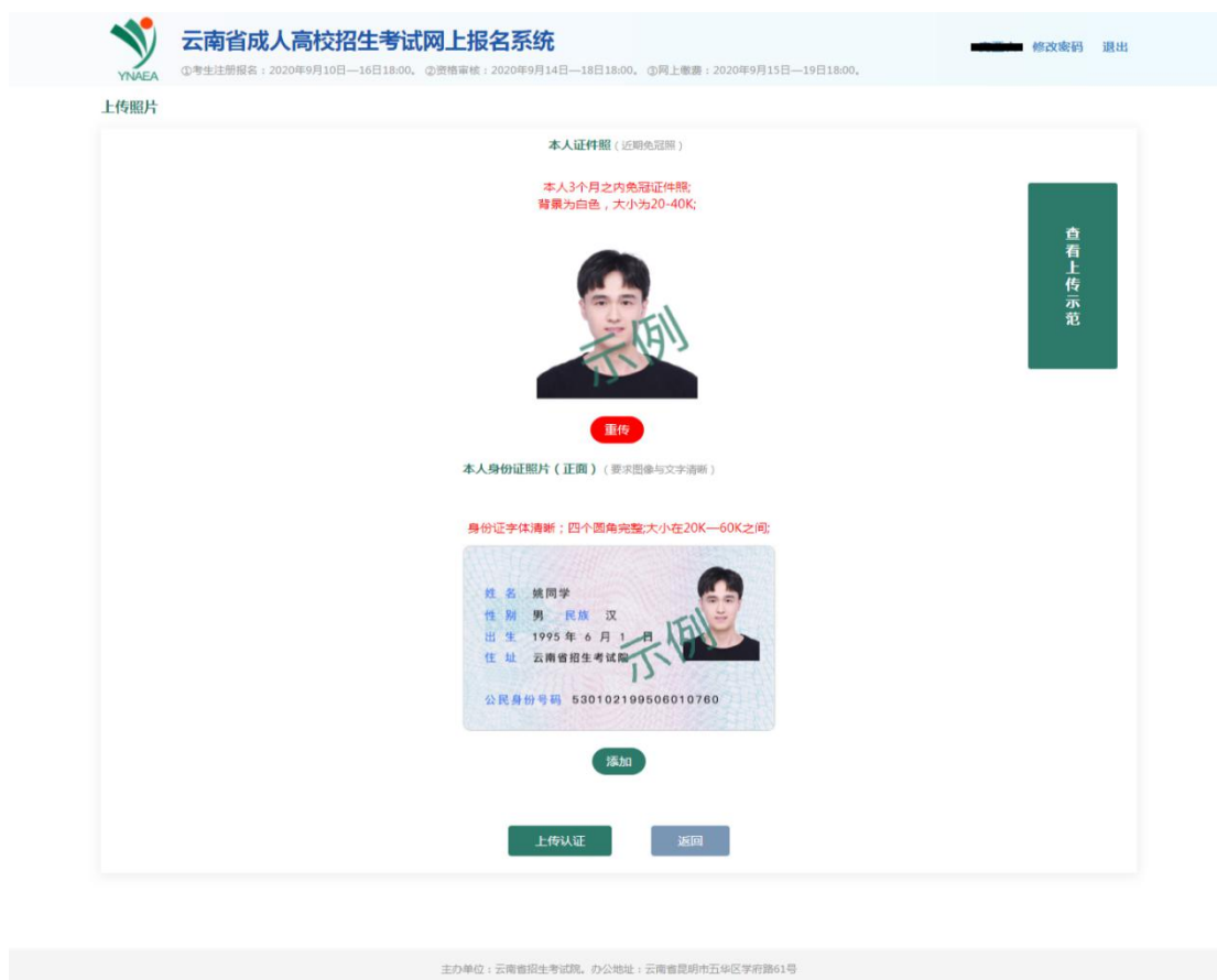
图 7 认证页面