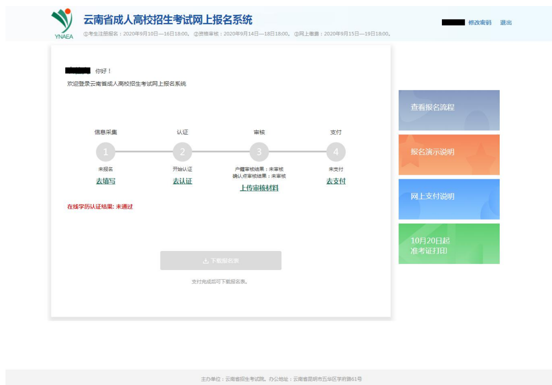
图 3 登录首页