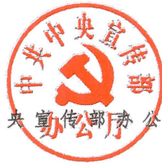
中央宣传部办公厅