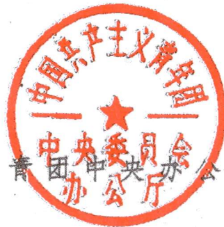
共青团中央委员会办公厅