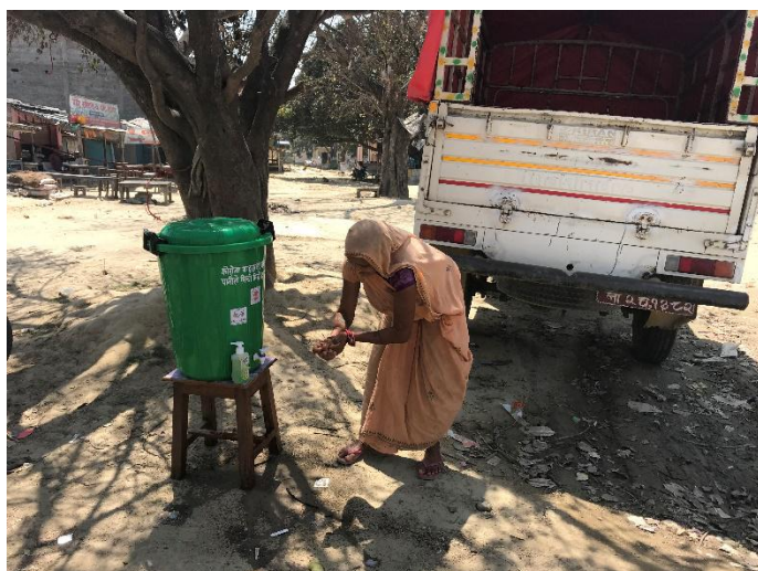
通往印度高速公路边的洗手桶已经破旧不堪，中国人民支持便民洗手站有洗手液。