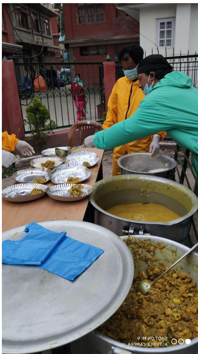
在加德满都居家隔离政策的第二周，许多打工家庭出现无钱买粮饥饿状态，尼泊尔政府开始