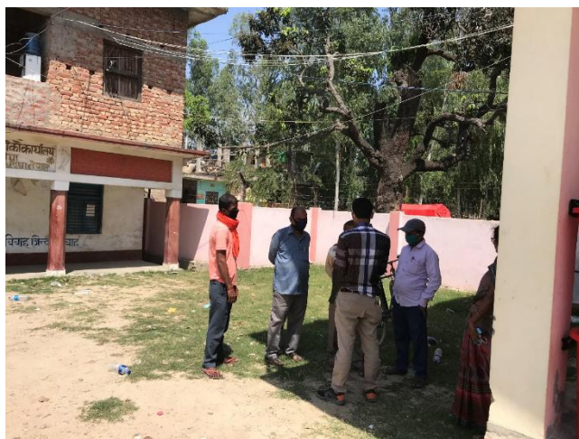
社区管理人员培训