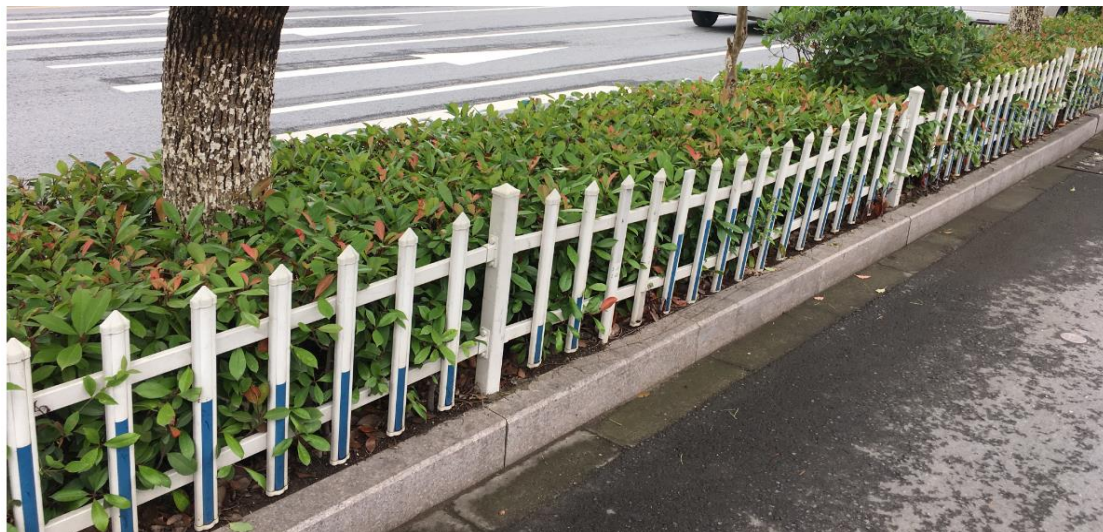
原有护栏参考照片