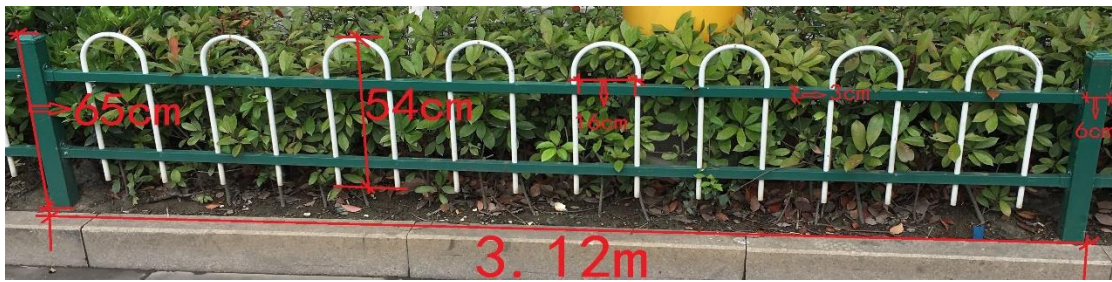
采购护栏参考照片

注：因考虑到振兴路的绿化带整体美观本次采购的绿化镀锌钢管护栏参照现有护栏制定规格配置。