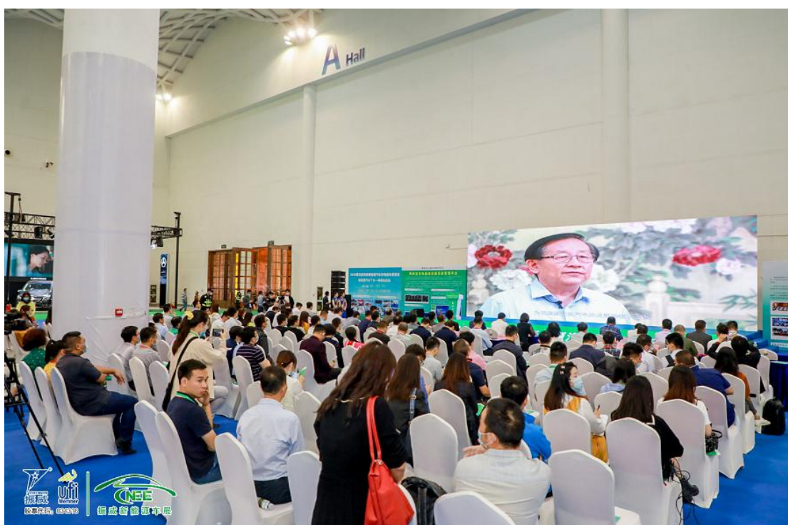
参会人员观看万钢副主席视频录播致辞