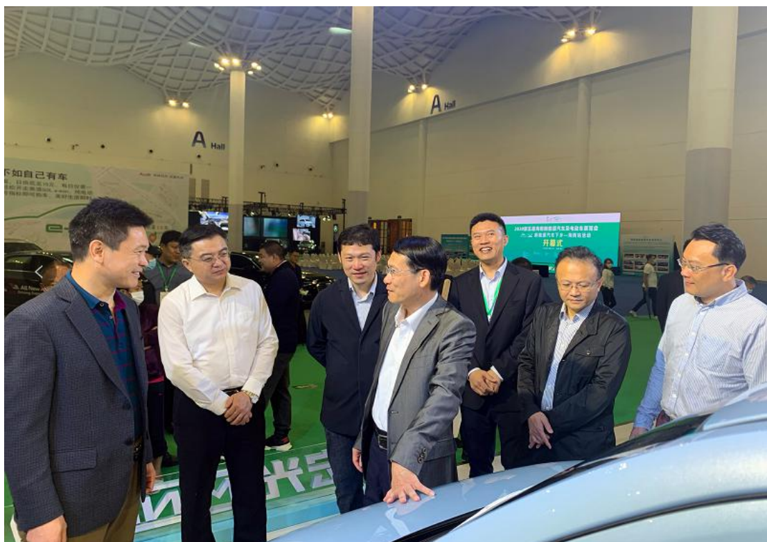
10月25日上午，沈丹阳副省长（前排中间）一行参观考察展会活动