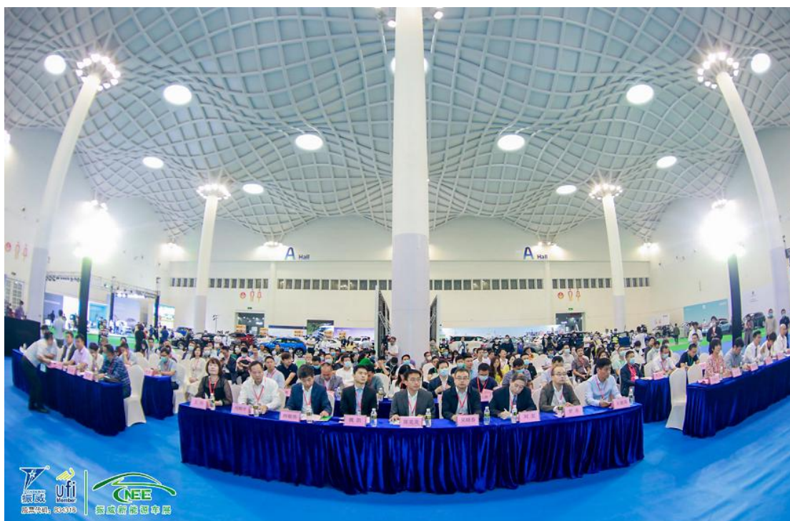
领导和嘉宾参加展会活动开幕仪式