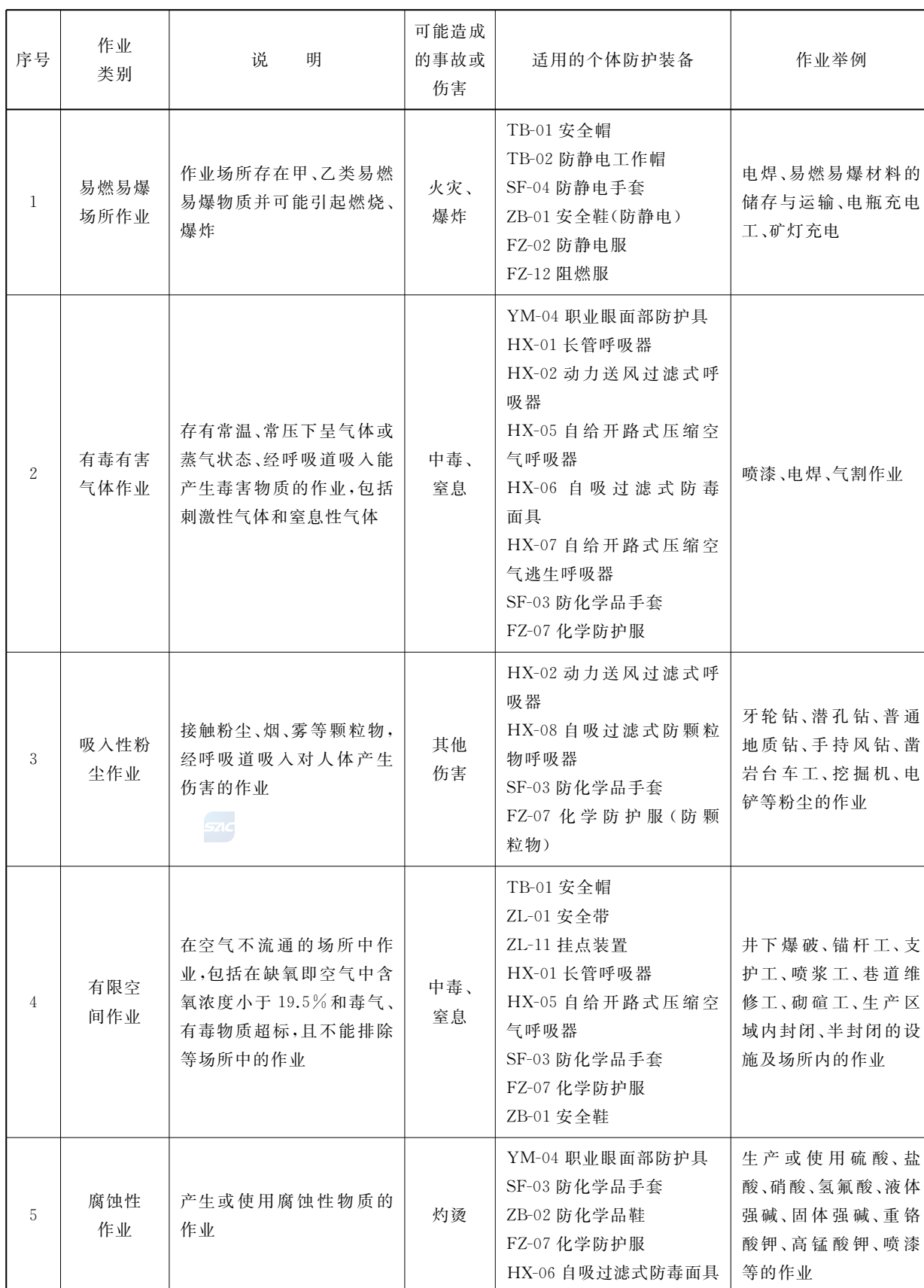
表 1 主要的作业类别、可能造成的事故或伤害类型以及适用的个体防护装备