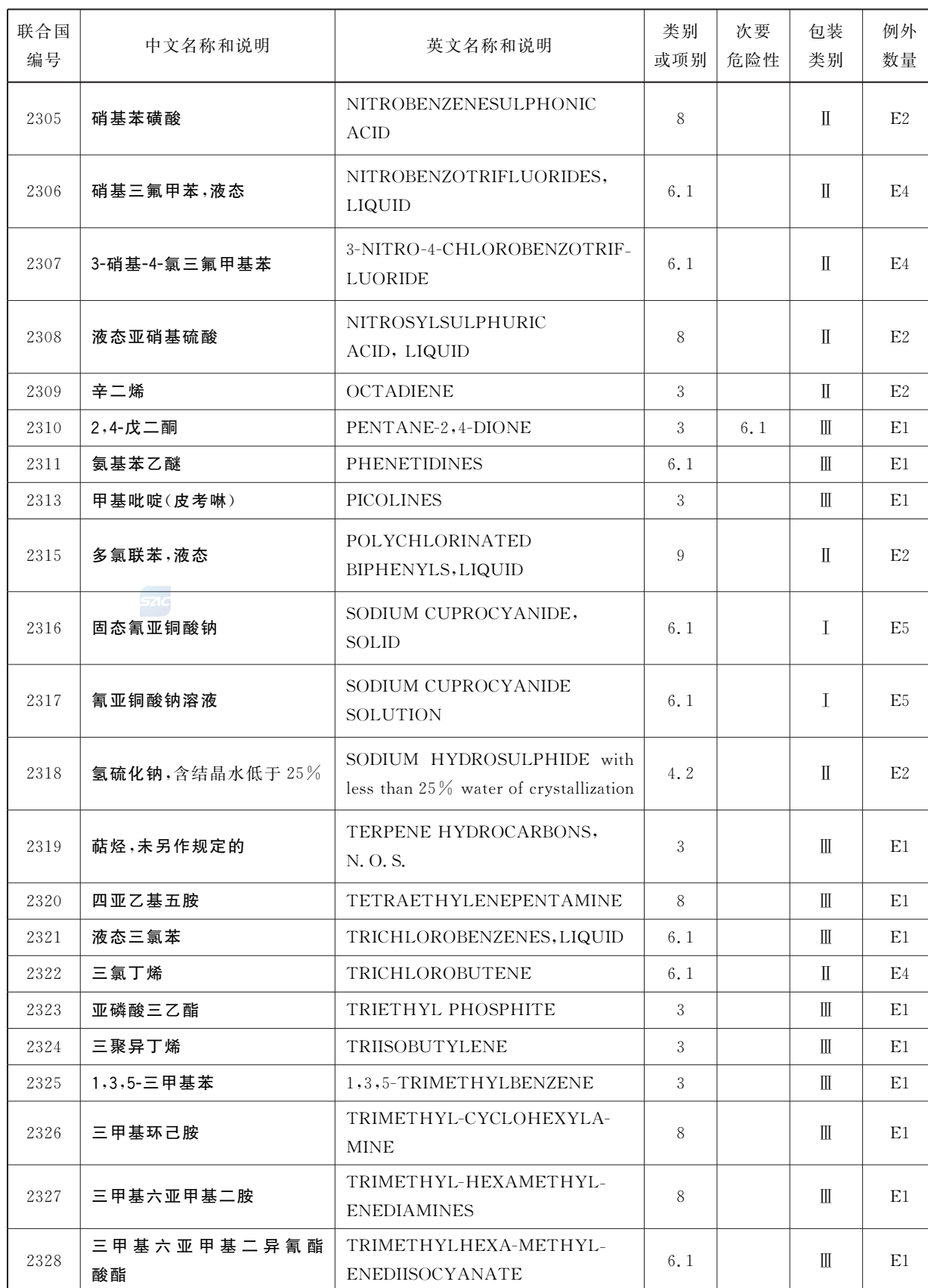
表 2 (续)