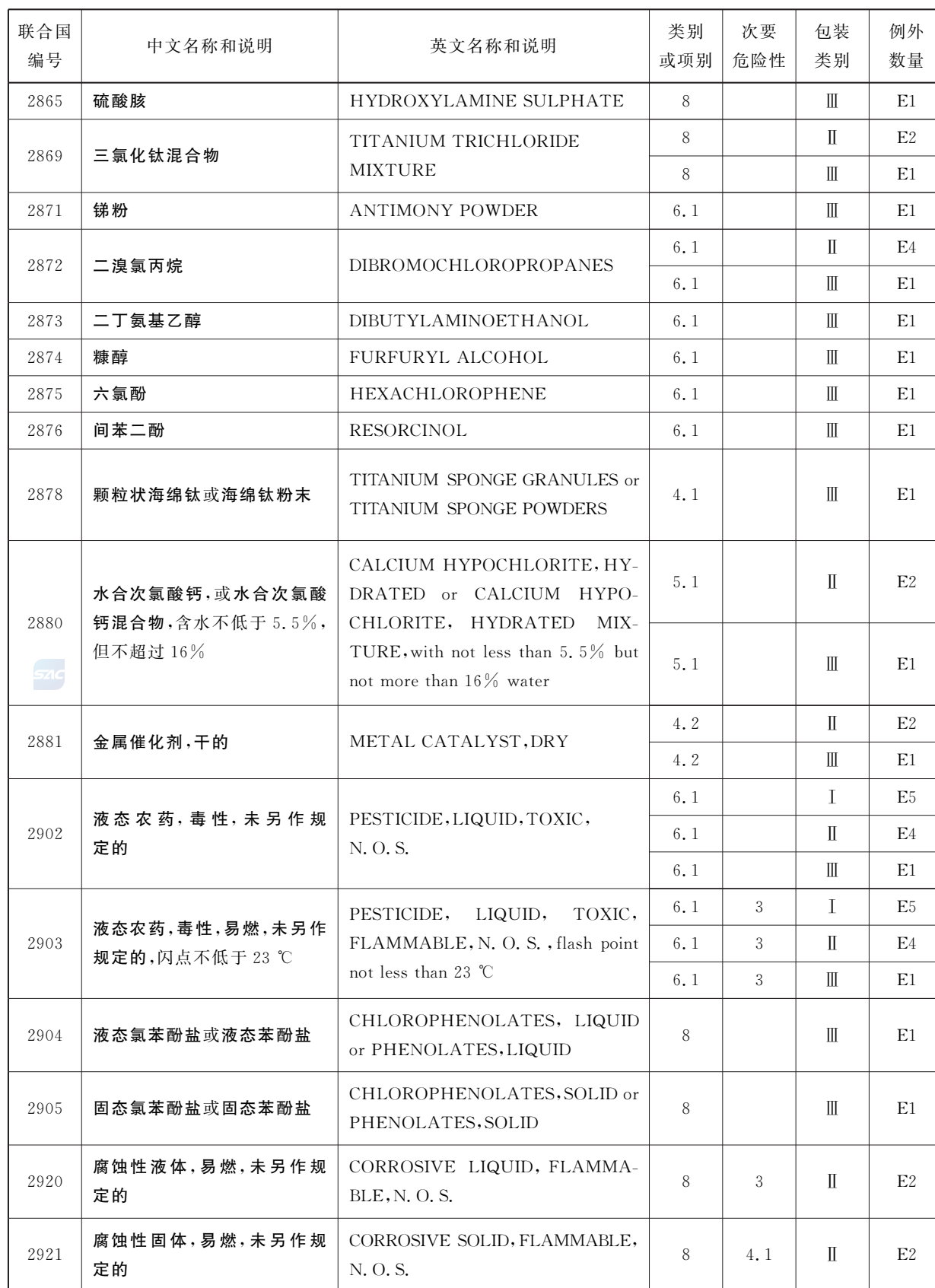
表 2 (续)