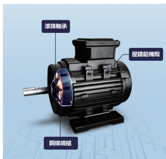
IP54保護級別 電機防水防塵