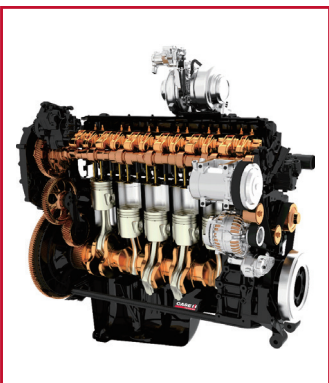
Cursor 发动机无 EGR, 免维护的高效选择性催化还原二代技术

凯斯 Magnum 系列拖拉机是一款针对重负荷作业的大型拖拉机, 可用于翻地、深松、激光平地等, 结合其多样的配置, 可以满足不同地区、不同客户的作业需求。