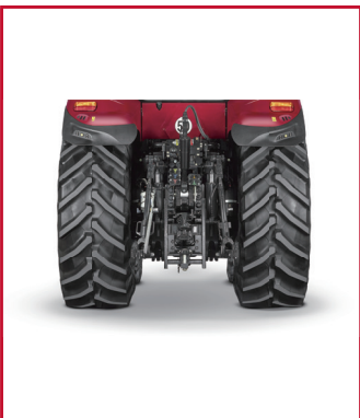
标配自动四驱、自动差速锁、车速雷达、打滑率控制系统, 五组可编程远程输出阀, ISOBUS 和 Powerbeyond