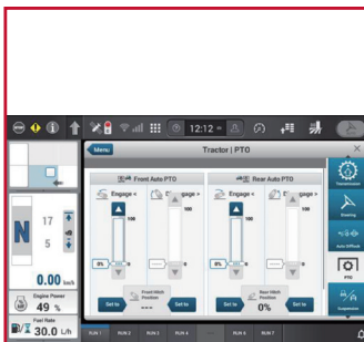
全新操作控制系统, 标配自动生产力管理功能