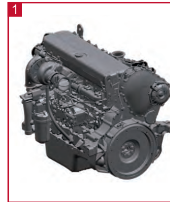
1 FPT Cursor13 发动机, EVGT 瞬动增压技术, 负载响应快, 扭矩储备大, 专为重负荷设计。

凯斯 Steiger 系列拖拉机是凯斯最大马力段拖拉机，集可靠、高效、舒适于一体，轮式和履带两种设计满足多种作业工况，是配套大型农机具高效作业的不二选择。