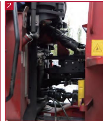
2 3 点震荡铰接, 耐用可靠, 牵引点位于车辆中心, 牵引力大。