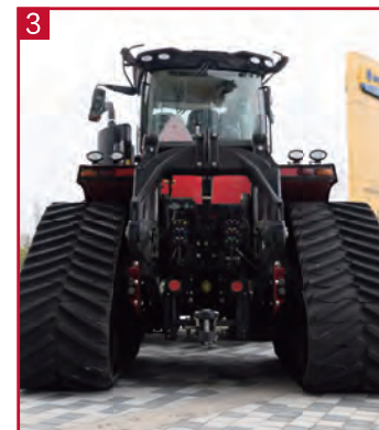
3 标配 IV 类重型三点悬挂, 6 组电子液压远程输出, POWER BEYOND, ISOBUS。适配多种农具。