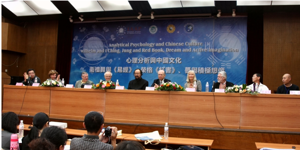
第六届心理分析与中国文化国际论坛开幕式

Opening Ceremony of the 6th International Conference of Analytical Psychology and Chinese Culture