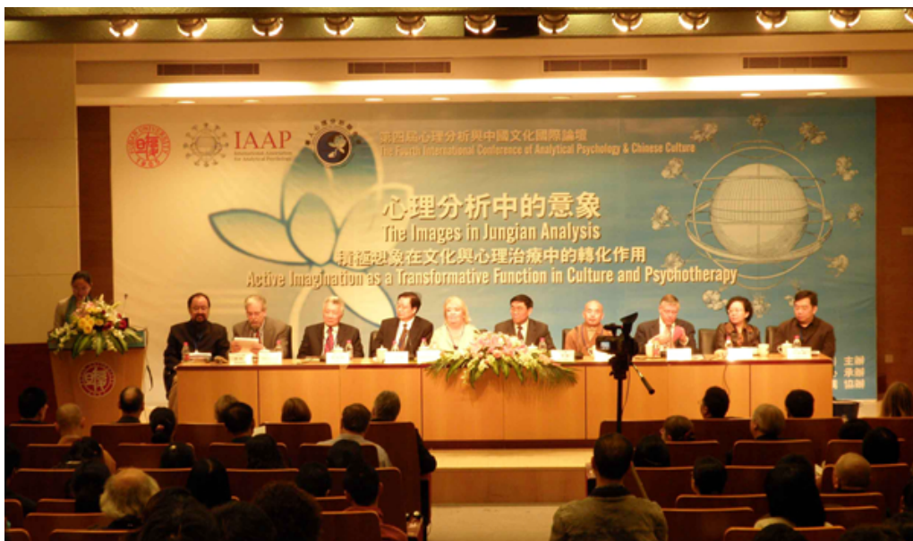
第四届心理分析与中国文化国际论坛开幕式

The 4th International Conference was held in 2009, with more than 400 Jungian psychoanalysts and scholars from all around the world attended. The theme of the conference is “The Images in Jungian Analysis: Active Imagination as a Transformative Function in Culture and Psychology”.