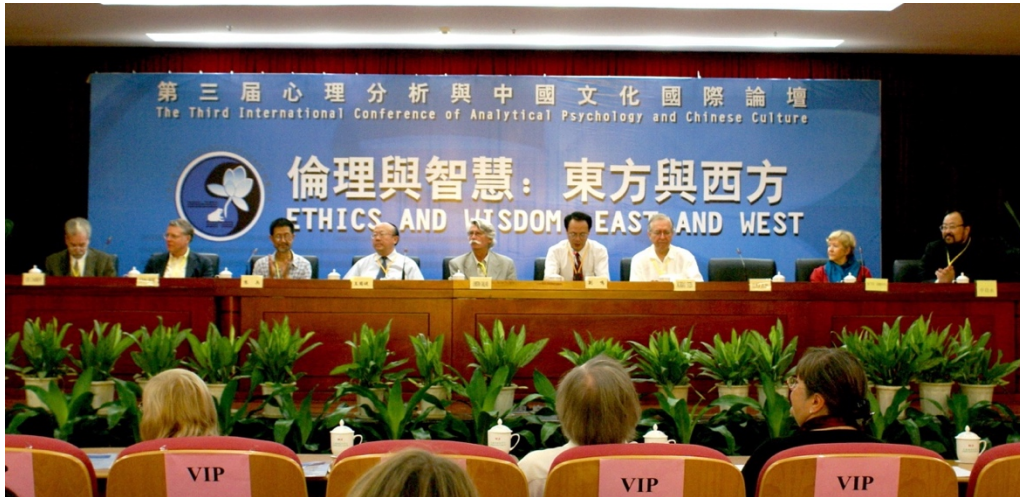
第三屆心理分析与中国文化国际论坛开幕式

Opening Ceremony of the 3rd International Conference of Analytical Psychology and Chinese Culture