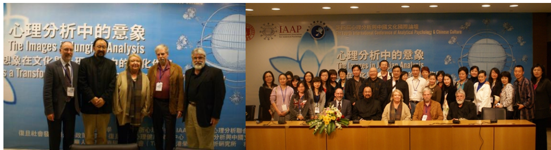
大会主要组织者 Main organizers of the conference