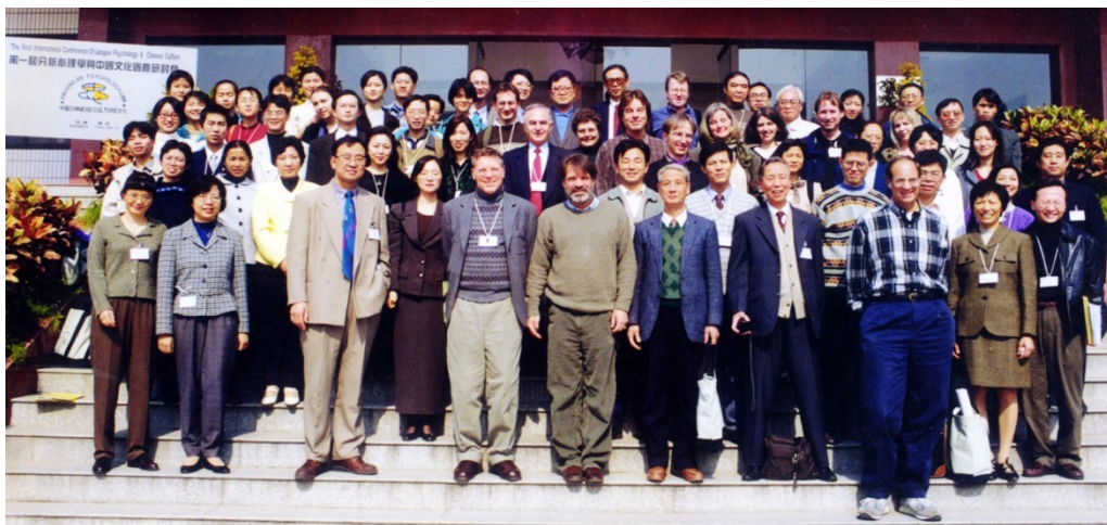
第一屆心理分析与中国文化国际论坛与会者合影

Opening Ceremony of the 1st International Conference on Analytical Psychology and Chinese Culture