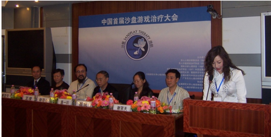
第一届全国心理分析与沙盘游戏大会（2008，中国昆明）

The 1st National Conference of Analytical Psychology and Sandplay Therapy (2008-Kunming, China)