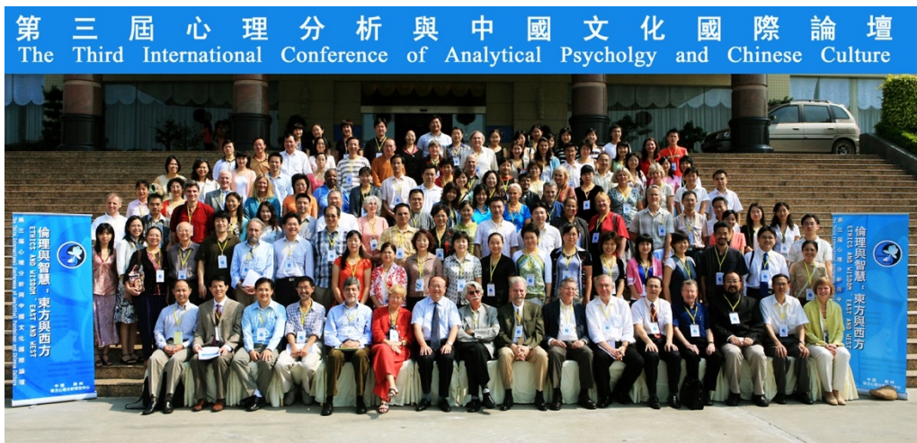
第三屆心理分析与中国文化国际论坛合影

Opening Ceremony of the 3rd International Conference of Analytical Psychology and Chinese Culture