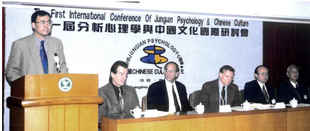
第一屆心理分析与中国文化国际论坛开幕式

The 1st Conference: “Analysis and Experience: East and West”