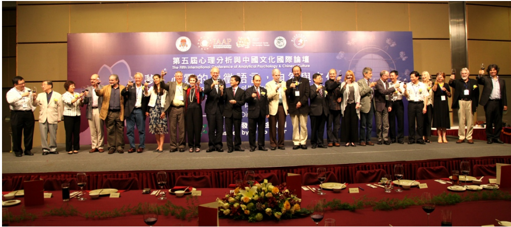
第五届心理分析与中国文化国际论坛主要报告人

Main lecturers of the 5th International Conference on Analytical Psychology and Chinese Culture