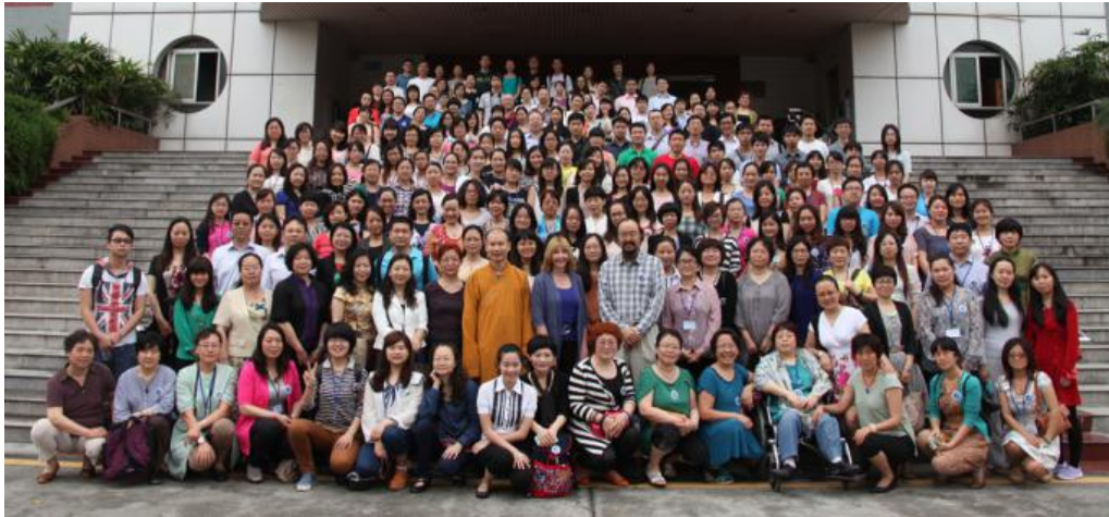
第四届全国心理分析与沙盘游戏大会（2012，中国广州）

The 4th national Conference of Analytical Psychology and Sandplay Therapy (2012, Guangzhou, China)