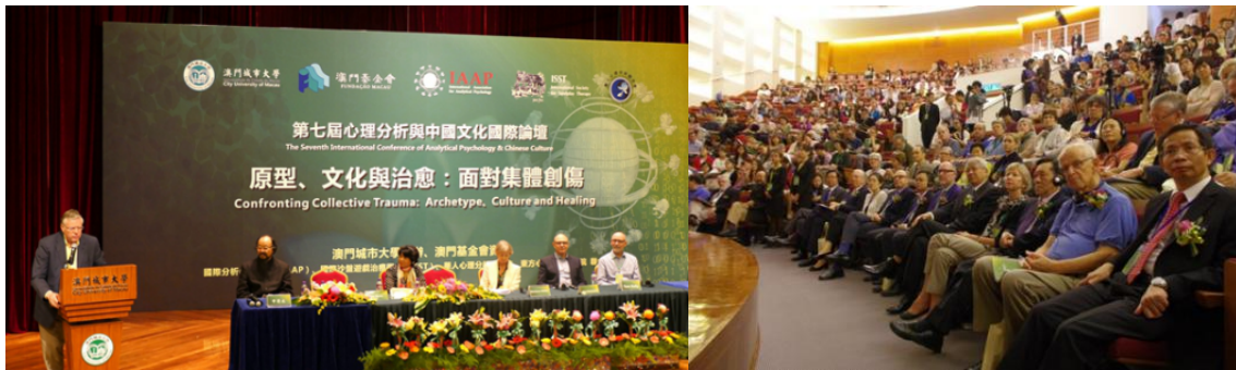
第七屆心理分析與中國文化國際論壇總結及會場一側

The First Forum on Analytical Psychology and Oriental Culture for Asian University Students