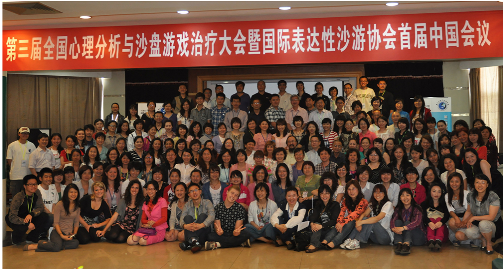
第三届全国心理分析与沙盘游戏大会（2011，中国成都）

The 3rd National Conference of Analytical Psychology and Sandplay Therapy (2011, Chengdu, China)