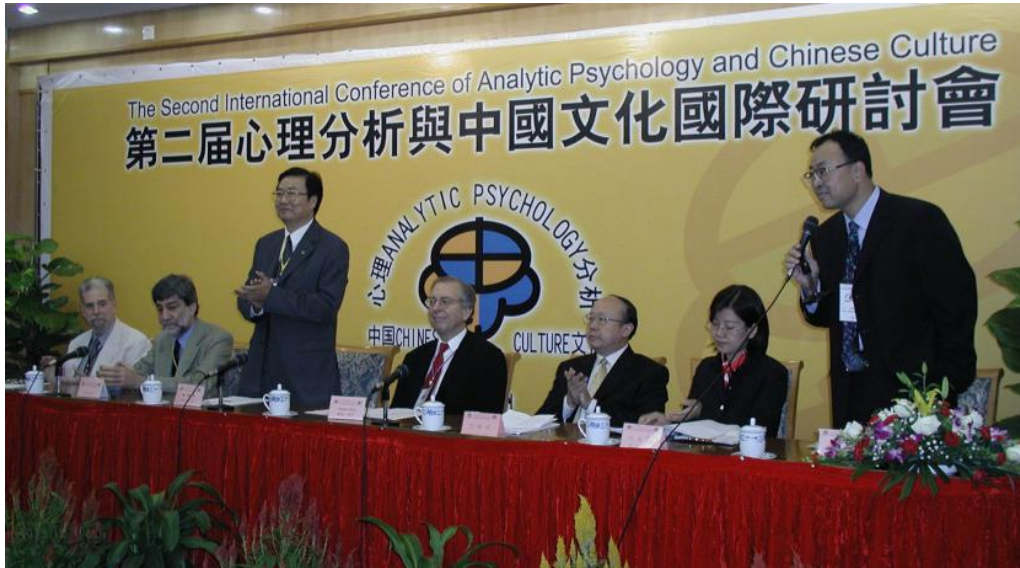
第二届心理分析与中国文化国际论坛开幕式

Opening Ceremony of the 2nd International Conference of Analytical Psychology and Chinese Culture