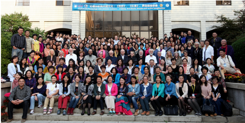
第五届全国心理分析与沙盘游戏大会（2013，中国青岛）

The 5th National Conference of Analytical Psychology and Sandplay Therapy (2013, Qingdao, China)