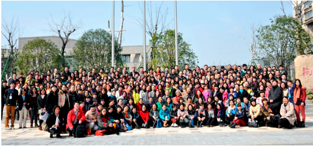
第六届全国心理分析与沙盘游戏大会（2014，中国杭州）

The 6th national Conference of Analytical Psychology and Sand play Therapy (2014, Hangzhou, China)