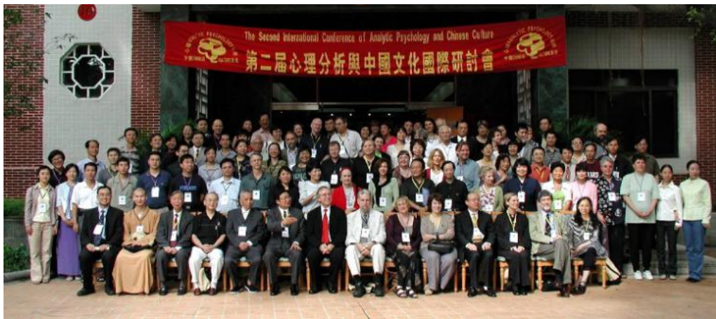
第二届心理分析与中国文化国际论坛合影

Opening Ceremony of the 2nd International Conference of Analytical Psychology and Chinese Culture