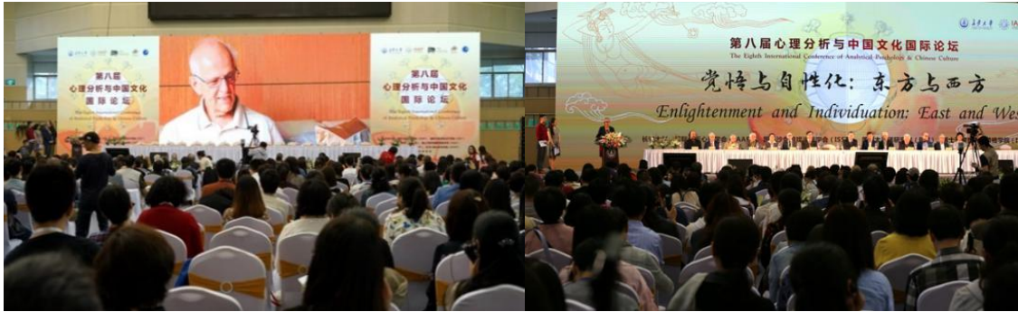
第八届心理分析与中国文化国际论坛开幕式

Opening Ceremony of the 8th International Conference on Analytical Psychology and Chinese Culture