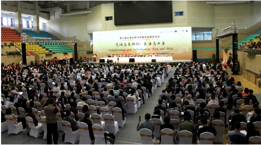
第八届心理分析与中国文化国际论坛有愈 800 人与会 Altogether 800 participants attended the 8th International Conference