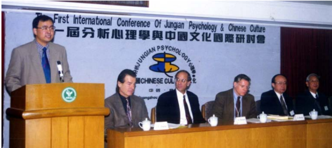
第一届心理分析与中国文化国际论坛开幕式 1998

第二届心理分析与中国文化国际论坛于 2002 年 9 月在广州珠江宾馆召开，五十余位国际著名心理分析师和 100 余位国内学者参加。大会主题是：“灵性：意象与感应”。国家卫生部副部长黄洁夫教授发来贺词，其中提到：“心理分析是心理治疗以及临床心理学的重要基石，结合中国传统文化研究心理分析有着深远的意义，必能促进心理分析学术研究的深入。通过国际之间的相互学习和交流，我国的心理分析及文化心理学必能不断发展，并能发挥其积极的心理教育和促进人们心理健康的作用。”