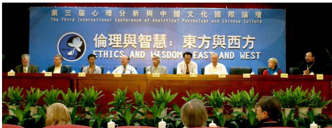
第三届心理分析与中国文化国际论坛开幕式（2006）

瑞士驻中国大使馆专门发来贺电，“卡尔·古斯塔夫·荣格是瑞士的心理学家，他的思想奠定了分析心理学的基础。他同时也是促进东方与西方积极的文化交流和理解的先锋。荣格与卫礼贤这位德国汉学家的相遇，在西方思想与中国传统之间架设桥梁当中，起了决定性的作用。荣格认识到东方哲学和宗教能极大地丰富西方的心理学，因此在思想开放、多元文化的理解和相互尊重的基础上，发起了东方与西方之间的对话。我们衷心希望‘心理分析与中国文化国际论坛’在丰富这一宝贵遗产方面获得成功！”