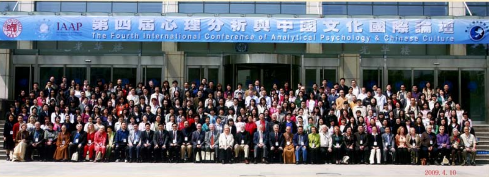
第四届心理分析与中国文化国际论坛（复旦 2009）

国际分析心理学会前任主席 Thomas Kirsch（他是 Murray Stein 之前的 IAAP 主席），在其大会致词中说：“亲爱的申荷永和第四届心理分析与中国文化国际论坛的与会者：此次大会的主题‘心理分析中的意象：积极想象在文化和心理治疗中的转化作用’与我们今天的生活息息相关，具有特别的意义。因为在我们多语种的世界，意象可以直接表达，不需要翻译。这也是分析心理学以及荣格心理分析的重要基础和特色。通过梦的分析，沙盘游戏，以及积极想象，意象的本质可以触发心灵的成长和治愈。分析心理学运用意象治愈作用的一个重要例子，便是申荷永教授和他的妻子高岚所组织的心理分析志愿者团队在最近中国大地震中的心理救助工作，他们投入了巨大的精力和时间，运用心理分析的专业技术来帮助修复灾区受灾者的心理创伤。复旦大学是当今中国最著名的三所大学之一，20 世纪 20 年代便拥有了心理学学院，高觉敷教授也在那时将弗洛伊德及其精神分析翻译引入了中国。现在，我们拥有了申荷永组织的复旦大学分析心理学与中国文化研究中心，这也正是心理分析与中国文化的重要发展。亚洲尤其是与中国传统有关的亚洲人中，似乎对荣格有着强烈的兴趣。我们的心与大家同在，祝愿大会的圆满成功，期待着从新老朋友和同事那里听到会议的盛况。”