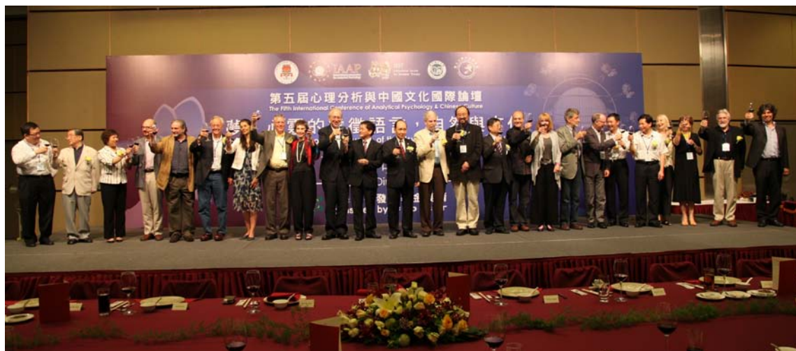
第五届心理分析与中国文化国际论坛大会主要报告人向与会者祝酒致意

第五届心理分析与中国文化国际论坛 2012 年 6 月 6-10 日在澳门（澳门大学）举行，由国际分析心理学会与国际沙盘游戏治疗学会，以及澳门大学、澳门城市大学和华人心理分析联合会联合举办。这是历史上国际分析心理学会与国际沙盘游戏治疗学会首次联合举办国际会议，双方主要负责人，主席、副主席和秘书长等均与会。国际著名心理分析师暨著名沙盘游戏治疗师，以及两岸四地专业学者数百人参加了会议。