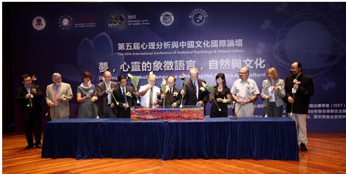
第五届心理分析与中国文化国际论坛

The Fifth International Conference of Analytical Psychology and Chinese Culture, 2012