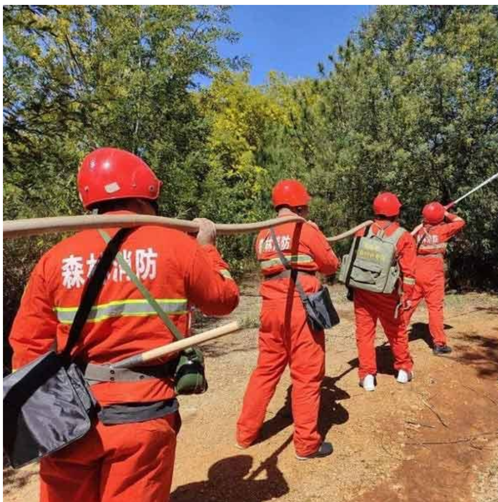
图二 尺寸 600*600 的，体积为 50kb 图片