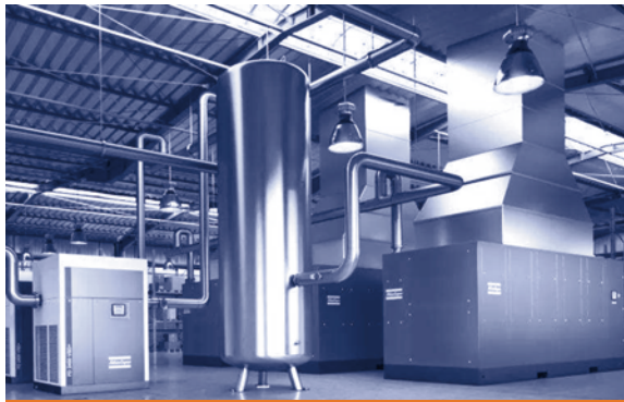
压缩空气消耗量测量