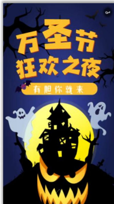
万圣节活动邀请函