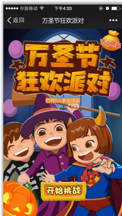
万圣节反应类游戏