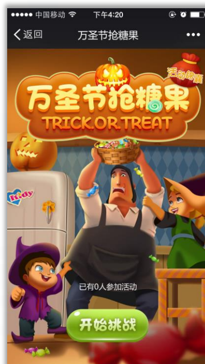
万圣节接物品游戏