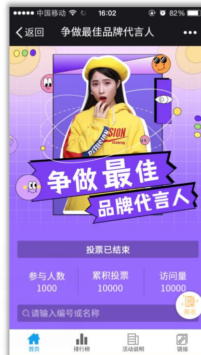
时尚达人投票活动