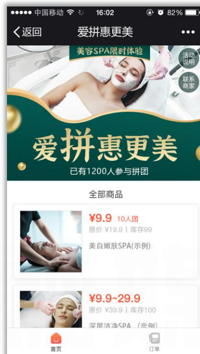
美容护肤拼团活动