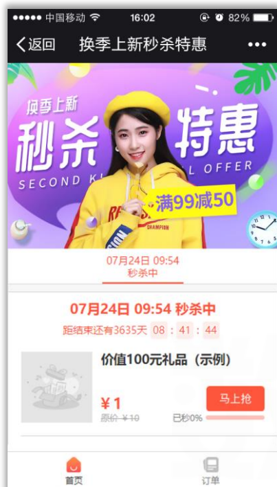
换季上新秒杀特惠