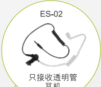
ES-02 只接收透明管 耳机