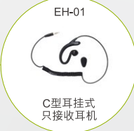
EH-01 C型耳挂式 只接收耳机