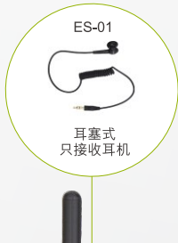
ES-01 耳塞式 只接收耳机