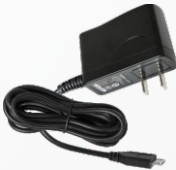
国标电源适配器 5V/1A PS1029