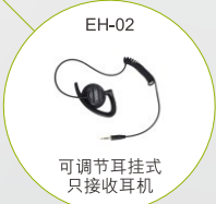
EH-02 可调节耳挂式 只接收耳机