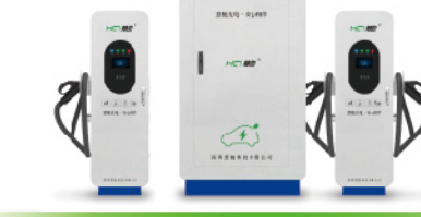
240-1280KW 矩阵式全柔液冷充电桩