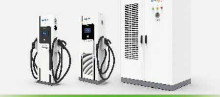
480KW 液冷分体式直流充电桩