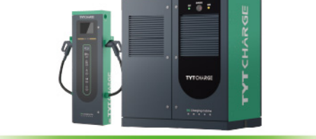
液冷型分体式直流充电桩