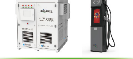
光储充一体化电源系统 超级液冷充电终端