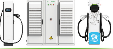
800kW天玑柔性共享超充堆