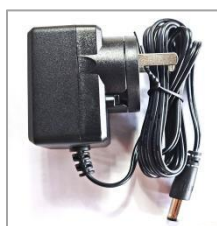
6V 适配器 W&T-AD1806A060030K (6V/0.3A)