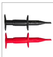
探头探钩 BP-368N (1000V/3A)